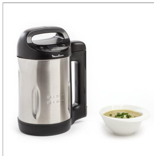
My daily soup noir 1,2l SOUPE MAKER LM542810