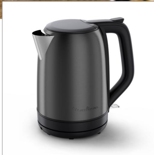
Bouilloire Subito Moulinex inox noir avec indicateur 1 tasse Subito, Bouilloire électrique, Indicateur 1 tasse, Ouverture à une main BY5S08E0