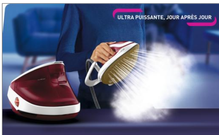
PRO EXPRESS ULTIMATE II 3000 W GRENAT ET BLANC CENTRALE VAPEUR GV9711C0