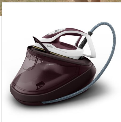
PRO EXPRESS ULTIMATE II CENTRALE VAPEUR GV9721C0