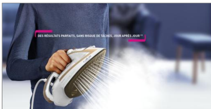
FER VAPEUR Puregliss 2900 W BLANC ET OR FER VAPEUR FV8042C0