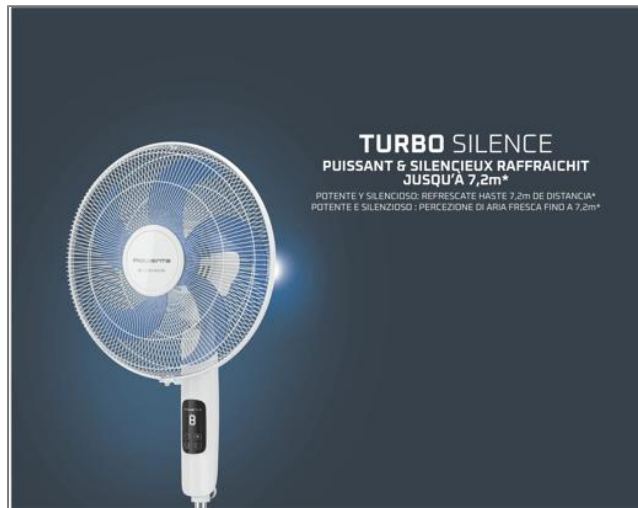
Turbo Silence, Ventilateur sur pied, Puissant, Silencieux, Ecoénergétique Ventilateur sur pied VU5450F0