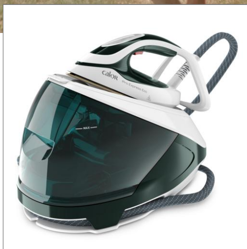
Pro Express Eco, Centrale vapeur éco conçue, 7,5 bars, pression 140 g/min, fonction pressing 560 g/min Centrale vapeur GV9E20C0