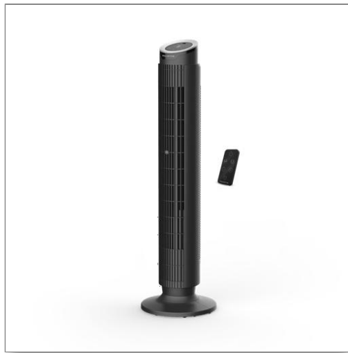
Eole Silence Force, Ventilateur tour, Rafraîchissement intense, Silencieux Ventilateur colonne VU7020F0