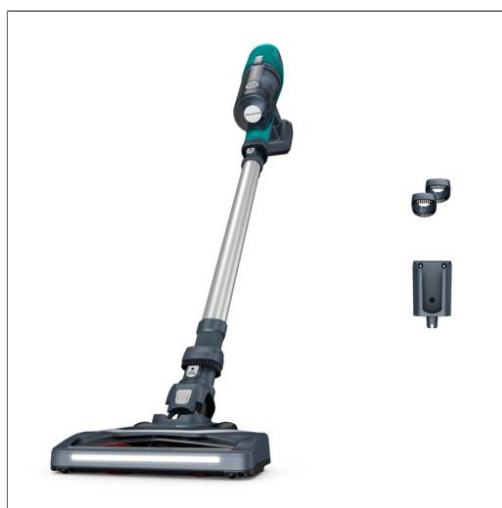
X-PERT 6.60 ESSENTIAL Aspirateur balai sans fil multifonction RH6820WO