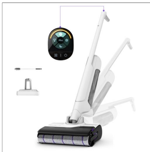
X-Clean 10 Aspirateur laveur sans fil, Longue autonomie, Nettoyage et séchage automatique Aspirateur laveur sans fil GZ7035WO