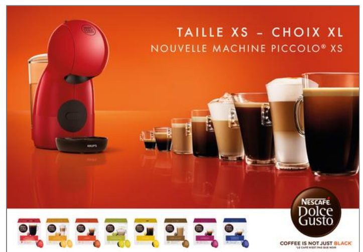
Bundle Piccolo XS rouge et 60 capsules Café Lungo Nescafé Dolce Gusto Machine expresso Nescafé Dolce Gusto YY5129FD