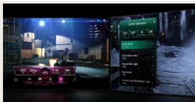
TABLEAU DE BORD & OPTIMISEUR DE JEU

L' intelligence artificielle s'invite dans votre interface webOS. Avec LG ThinQ , commandez votre téléviseur à la voix, que ce soit pour trouver votre prochain contenu à regarder en fonction de vos goûts, pour contrôler les objets connectés de votre foyer ou encore pour faire une requête à votre AI ChatBot .